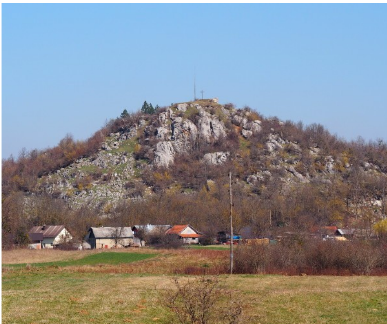
Pogled sa zapada na brijeg Gradina s vršnom kamenitom hridi na kojoj se nekoć uzdizala srednjovjekovna utvrda Bilaj