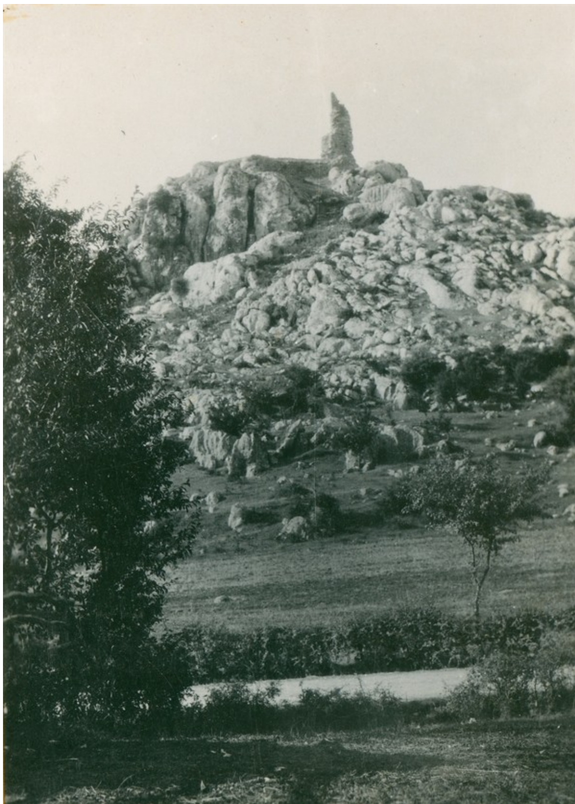
Ruševine Bilaja na brijegu Gradina, s rijekom Likom u prvom planu, na fotografiji Većeslava Henneberga iz 1931. godine

polja, upadljivo uočljiv iz šire okolice, svakako se već i promatraču izdaleka doimao "belim" gradom (Hrvati doseljeni nakon protjerivanja Turaka, koji su govorili ikavicom, prozvali su ga "bilim"). Danas se na stjenovitom vrhu Gradine, nedaleko desne obale rijeke Like, nalaze neznatni ostaci srednjovjekovnog utvrđenja.