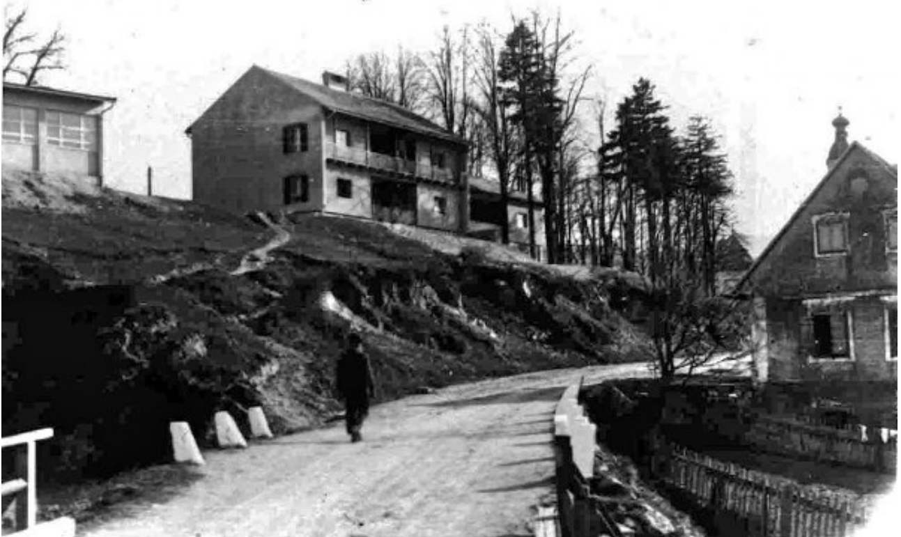
Stambena zgrada na brežuljku u Plaškom sagrađena 1954. po projektu arhitekta Kazimira Ostrogovića, na fotografiji snimljenoj oko 1960. godine

s priličnom sigurnošću tvrditi da se predmetno grobište nalazilo u blizini srednjovjekovne crkve Sveti Stjepan, danas nepostojeće, koja je stajala na brežuljku koji se uzdiže u blizini mjesta gdje se spajaju plašćanske rječice Dretulja i Vrnjika. Navodno je još postojeći zvonik crkve do 1664. bio preuređen i dograđen u četverostranu obrambenu kulu Petra Zrinskog. No, kula je, baš kao i prethodno crkva, odavno srušena, a i okolnom groblju se - za sada - zameo trag.”.