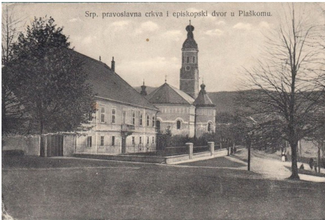
Saborna crkva Vavedenja Presvete Bogorodice i vladikin dvor u Plaškom 1917. godine

nalazi Dom kulture u Plaškom, na brežuljku u blizini mjesta gdje se spajaju plašćanske rječice Dretulja i Vrnjika.”.