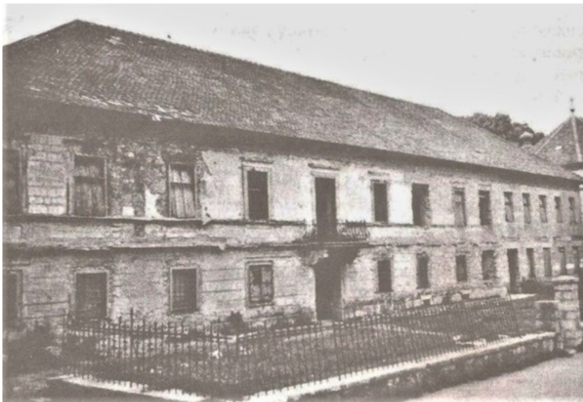
Stanje episkopalnog dvora u Plaškom nakon Drugog svjetskog rata, u kojem je oštećen u podmetnutom požaru

U srednjem vijeku, kada je razdoblje mira ustuknulo pred ratnim dobom, brežuljak je umjesto svetišta i počivališta pokojnika dobio vojno-obrambena zdanja (* 4). Njegov položaj pokazao se prednošću i u tim okolnostima neposredne životne opasnosti po ljude Plaščanske doline. Moguće je da su i pojedini dijelovi brežuljka, koji se doimaju ili uzvišeni (nasipani) ili zaravnjeni, upravo u to nesigurno vrijeme preuređeni ljudskim naporom, kako bi se ta važna obrambena točka dodatno učvrstila i ojačala. I ovu pretpostavku mogla bi dokazati ili opovrgnuti samo sustavna i cjelovita arheološka i druga znanstvena istraživanja, koja trenutno nisu niti na vidiku.