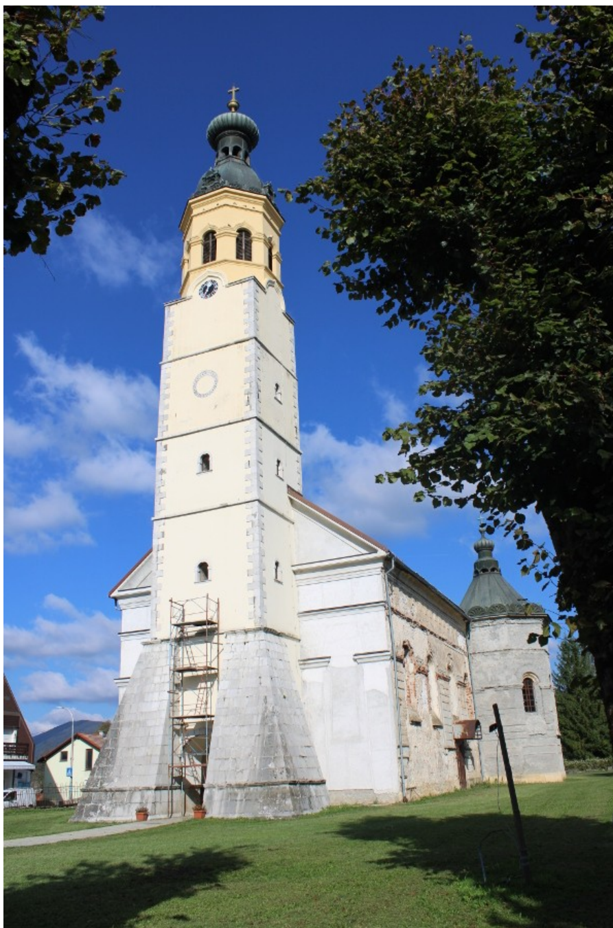
Saborna crkva Vavedenja Presvete Bogorodice, uz koju se početkom 20. stoljeća nalazio ogroman, gotovo 3,4 tone težak, "Gavranov" stećak

Na prvo istraživanje, tek manjeg dijela plaščanskog brežuljka i njegovih padina, uputili smo se 15. listopada 2021. godine. Zbog bujnog raslinja, ali i povodnja Dretulje, nismo uspjeli prošetati podnožjem brijega iznad korita rječice u potrazi za još nekim mogućim zaostalim stećkom. Razgledali smo tek djelić sjeverne padine podno zgrade u kojoj djeluje Područna ambulanta Plaški Doma zdravlja Ogulin, potom obišli obližnji most preko Dretulje i ribnjak, a obilazak ostatka brijega odgodili za sušnije razdoblje te kada više ne bude zelenila. Razgledali smo i okoliš Saborne crkve Vavedenja Presvete Bogorodice i mjesto na kojem se nalazio obližnji episkopalni dvor. Na prostoru nekadašnjeg dvora danas je tek parkovna livada. Istočno od nje je prostor koji je prilično zarastao u guštik, s dijelom sačuvanih ali ruševnih gospodarskih episkopalnih zgrada, kao i ostacima podruma jedne od takvih srušenih zgrada, pristup kojem je zatrpan smećem. Južno, u neposrednoj blizini, smještena je zgrada osnovne škole.