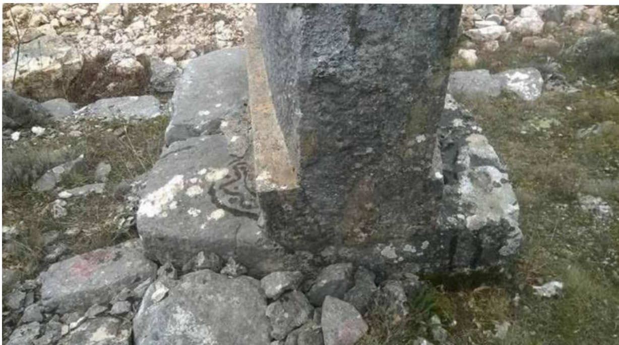
Svastika vidljiva s desne strane. S lijeve polumjesec s poskokovim šarama...