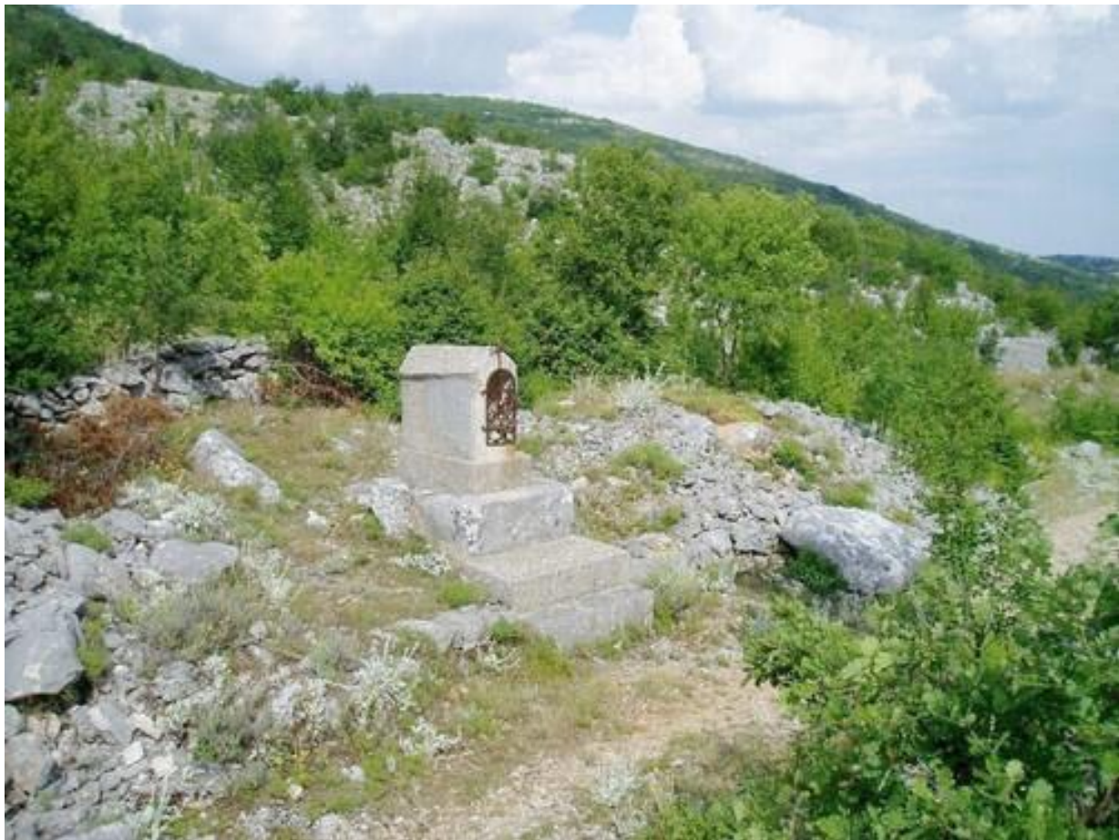
Kapelica u stećku na postamentu sa svastikom.