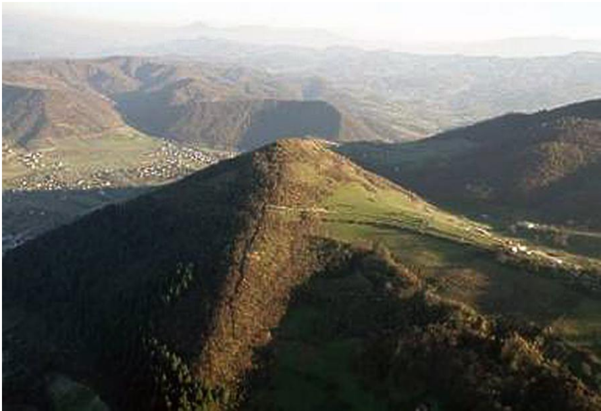
Fotografija: Zahodna in severna stran Bosanske piramide Sonca z jugozahodnim in severozahodnim robom