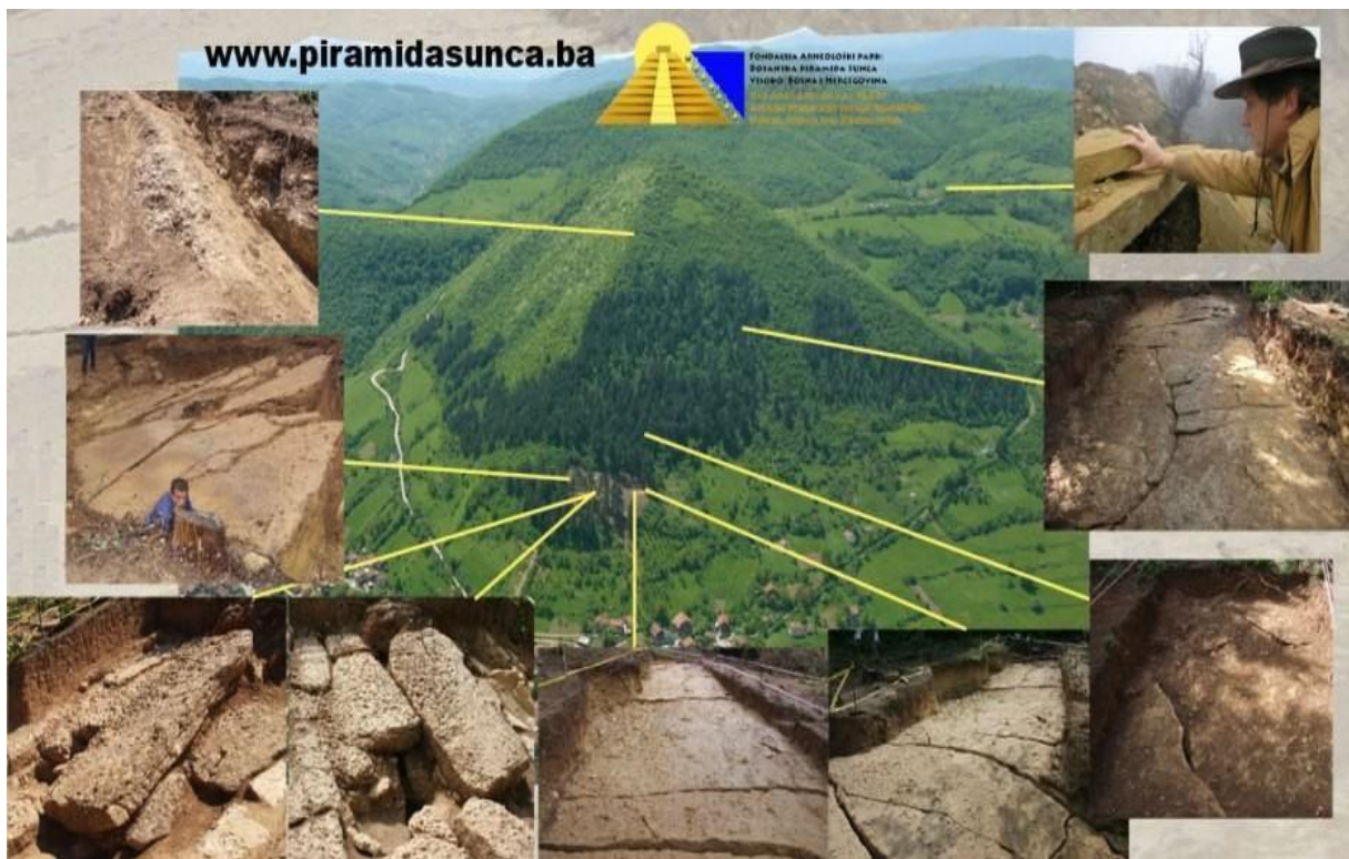
Ilustracija: Nekaj arheoloških sond jasno kaže, da se meter pod plastjo zemlje nahaja gradbena konstrukcija, sestavljena iz blokov.