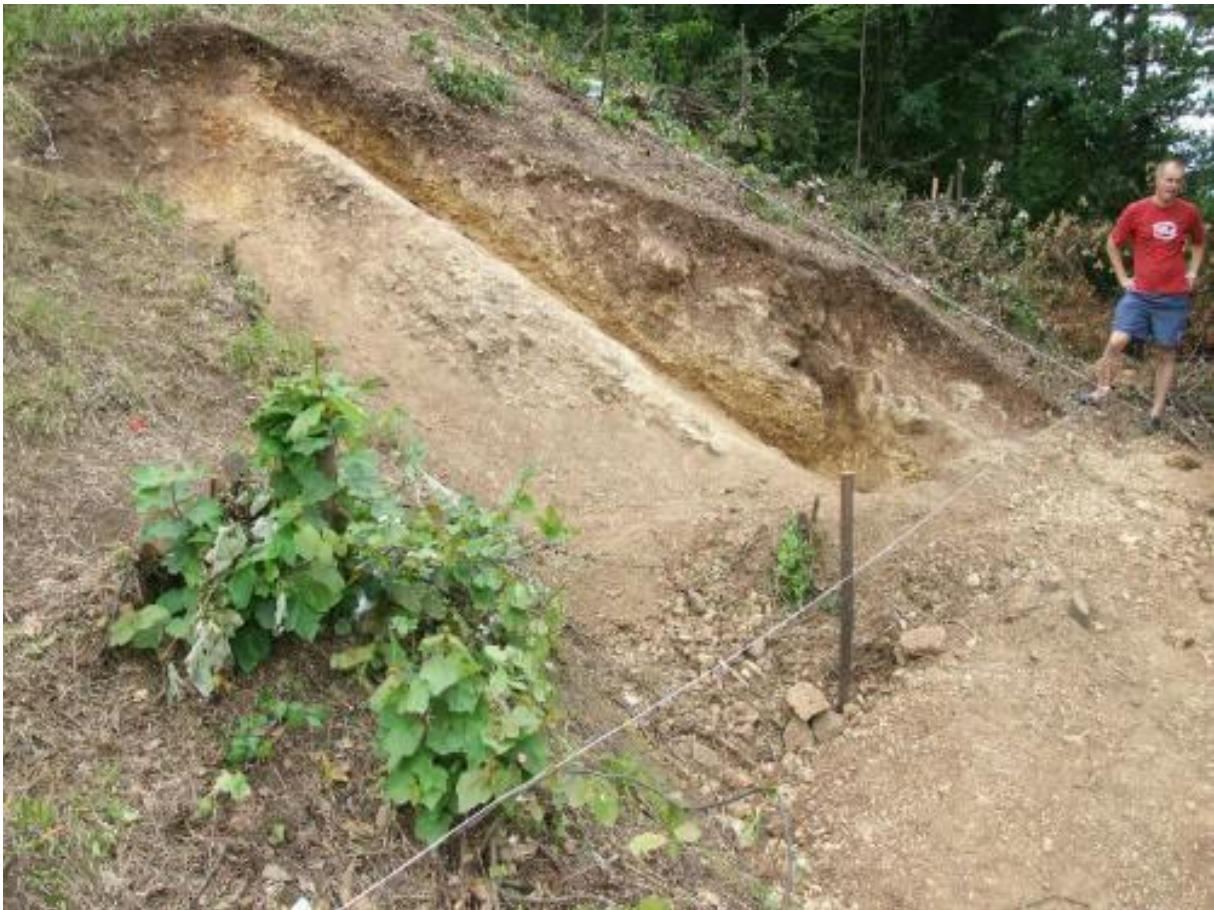
Fotografija: Severovzhodni rob Bosanske piramide Sonca

To ne drži. Ekipe Fundacije so izkopavale na dveh vogalih ali robovih (severovzhodnem in severozahodnem) in odkrile zelo jasne robove.