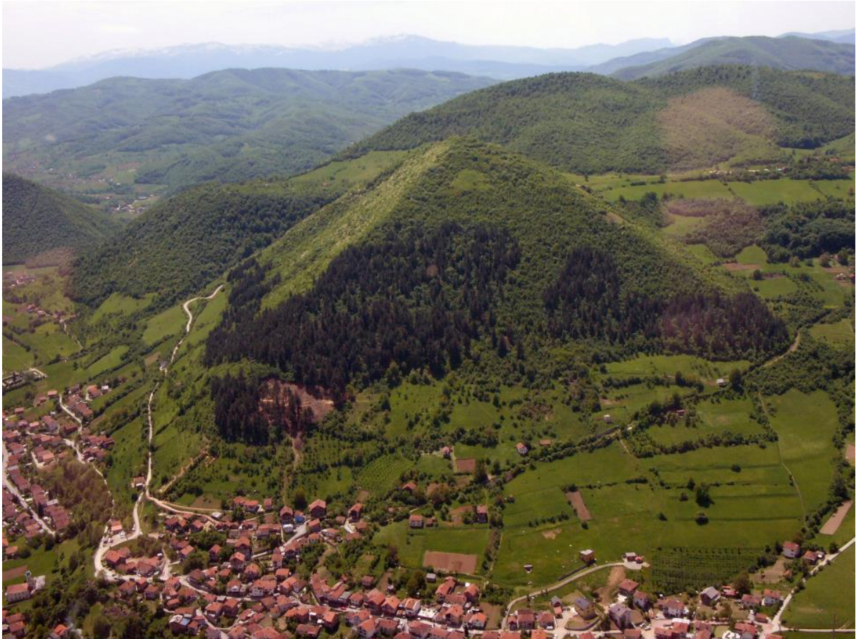
Fotografija: Severna in vzhodna stran Bosanske piramide Sonca s severovzhodnim in severozahodnim robom