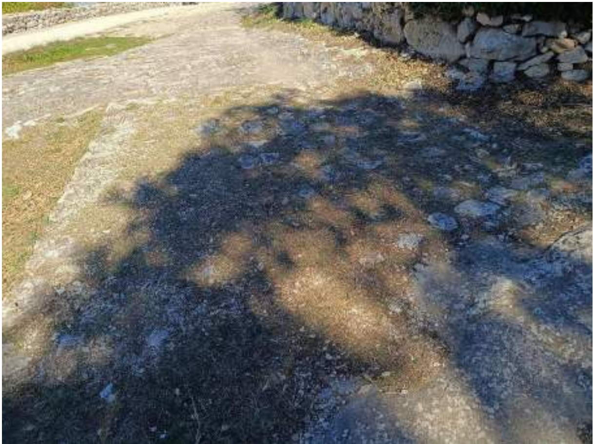
Rupe uz rub dromosa nekoć su osvjetljavale trasu po mraku