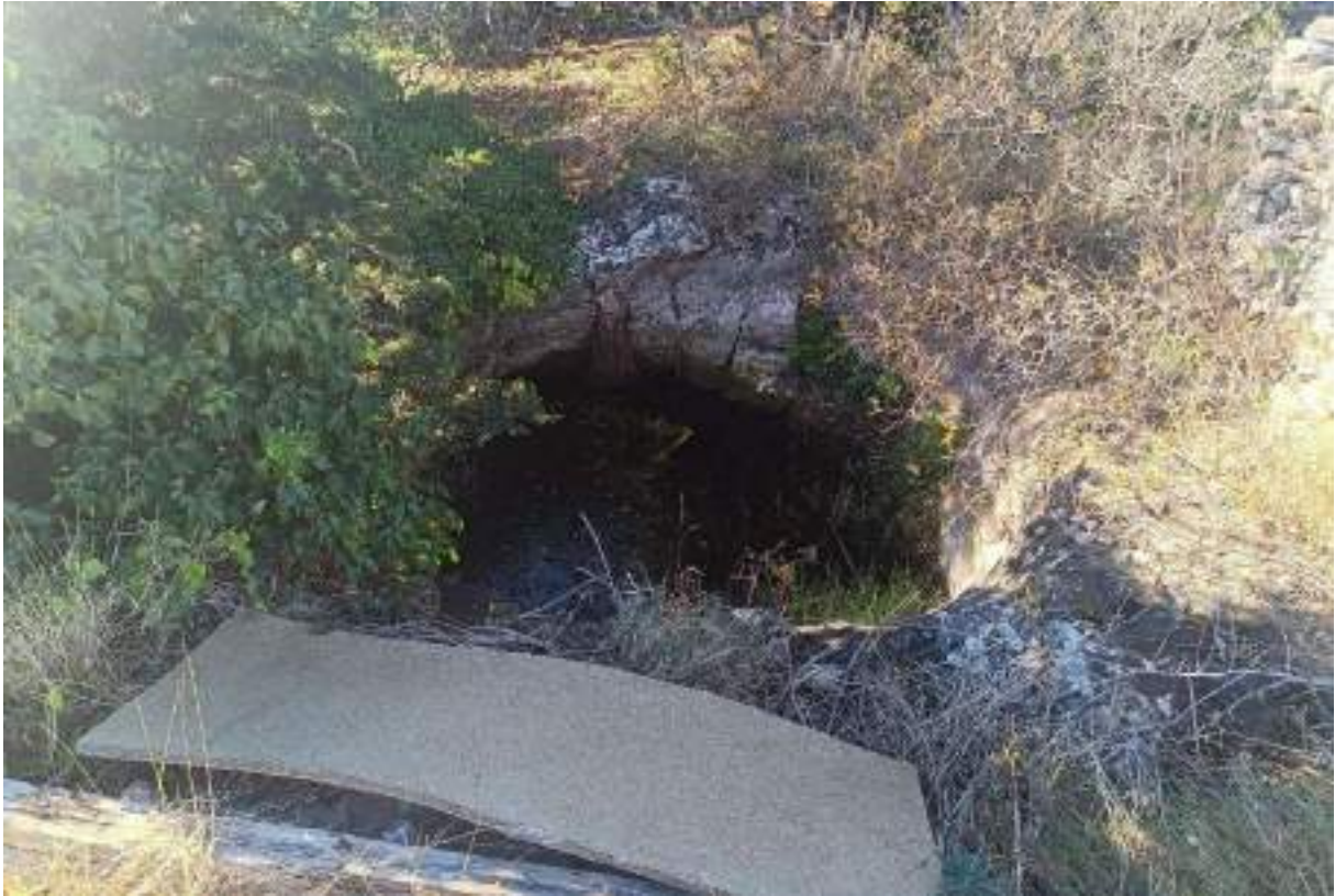
Sa sjeverne strane Škrip obiluje ovakvim platoima i manjim pećinama