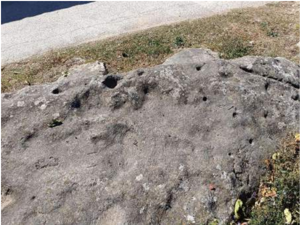
Ostavi drevne preše za masline potvrđuju da se maslina uzgajala i u antici